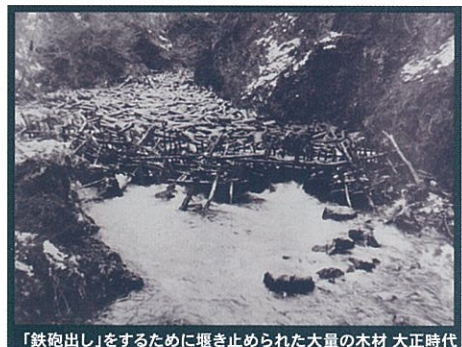
「鉄砲出し」をするために堰き止められた大量の木材 大正時代