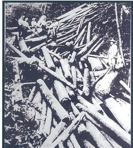
奥山の木材を深い谷に落として運ぶ「谷出し」大正末期