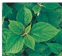
からむし 苧 Ramie ラミー

今日では無毒な大麻が栃木県等でわずかに生産され、主に神事用として神社、伝統工芸や伝統芸能に使用されている。