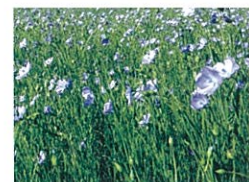
あま 亜麻 Flax フラックス

アマ科の一年生で、西アジア原産。高さは約1m。日本では明治以降、冷涼な気候の北海道のみで栽培。