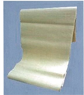
きびら 反物(生平) たていと ぼうせき よこいと てう (経糸が紡績、緯糸が手績み)