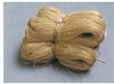
てう かせ 手績みの糸 (大麻)