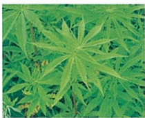
たいま/あさ 大麻 Hemp ヘンプ

アサ科の一年生、中央アジア原産。約110日で2~4mに生長する。皮から繊維を取り、種は調味料、油にする。古くから麻といえば大麻を指すことが多い。