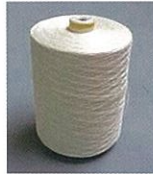
たて いと 経糸 (紡績麻糸)