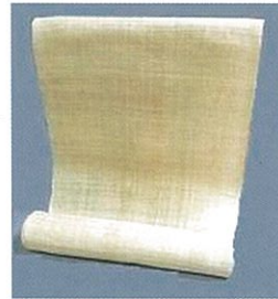
きゆうせい 反物(旧製) たていと よこいと てう (経糸・緯糸ともに手績み)