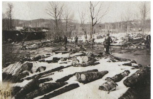
まだ雪深い中での流送