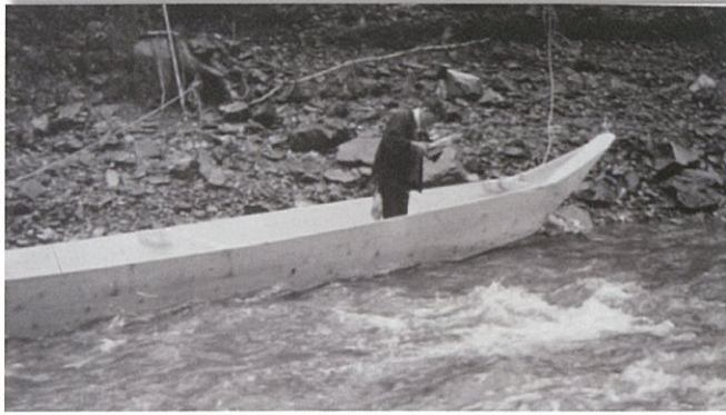
庄屋(頭)が新舟に御神酒を捧げる