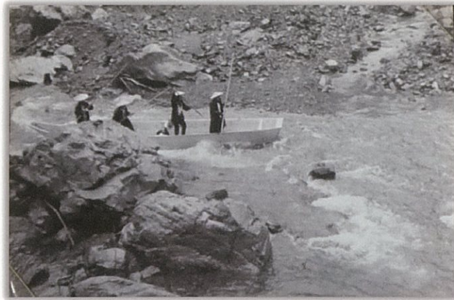
大井川の岩場をくぐり抜ける